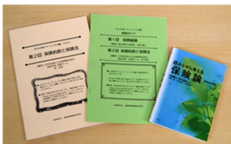
テキスト&レジュメ