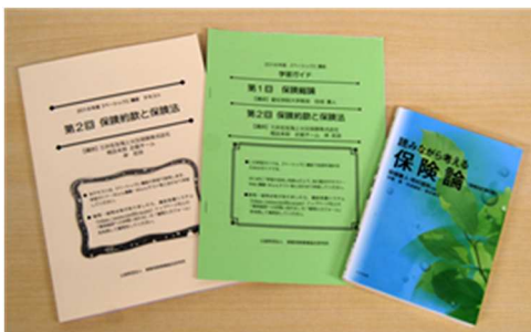
テキスト&レジユメ